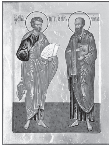
Святые апостолы Петр и Павел. Современная икона.

Преподобный Варлаам Хутынский родился в Новгороде, основал и был первым игуменом Спасо-Преображенского Хутынского монастыря в 10 верстах от Новгорода. Прославился множеством чудес.